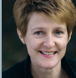
Simonetta Sommaruga SP-Ständerätin, Köniz

Öffentliche Veranstaltung; der Eintritt ist frei.